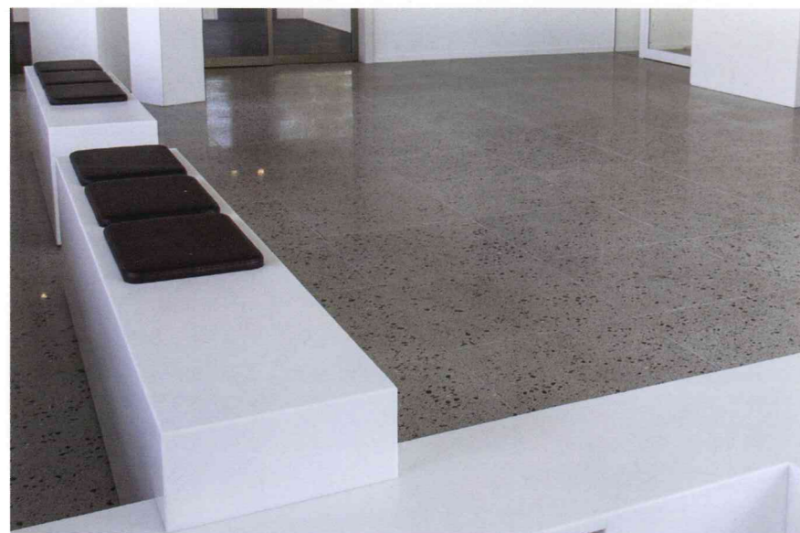
Aménagement d'un espace de collectivité

Mais pour comprendre comment intégrer le composite dans des réalisations actuelles, rien ne vaut un petit traité technique. Véritable ersatz de pierre, le Terrazzo se situe hors du temps. Sa composition à base de pierre, de verre, de granit ou de tout autre élément puise ses racines dans des fabrications ancestrales. Une fois choisies, les différentes matières sélectionnées pour leur résistance, leur couleur, leur effet, leur rendu sont mélangées et amalgamées entre elles à l'aide de ciment. Une fois durcies, elles forment un matériau uniforme extrêmement résistant à l'usure et qui ne demande pas ou presque pas d'entretien. C'est d'ailleurs et principalement pour cette raison que l'on retrouve le Terrazzo au niveau des revêtements de sols.