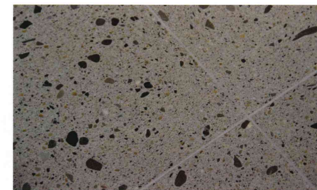
Détail du Terrazzo avec joints de 1,5 - 2 mm