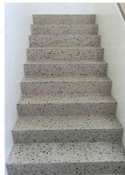
Application sur un escalier

Quelle que soit la finition choisie, le Terrazzo vieillit remarquablement bien. Avec le temps, la matière se patine pour donner encore plus d'ampleur à ses assemblages.