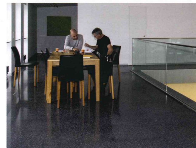
Le Terrazzo poli noir avec polissage final sur place

Imprégnation Ne change pas l'aspect naturel de la dalle, oléofuge + hydrofuge (base), contre les acides (totale)